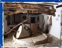
MOLINO DE MARCELO. SEDILLA